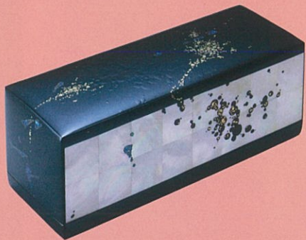
岸本主司「金胎螺鈿時絵漆箱『花揺れ』」平成25(2013)年 作家蔵