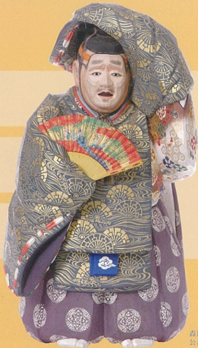
森川杜園「一刀彫 融」明治20(1887)年 公益財団法人 名勝依水園・奈良美術館蔵