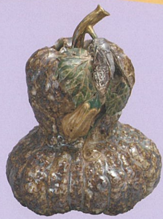
奥田木白「赤膚焼 鯉飾付唐茄子形花器」江戸時代 公益財団法人 名勝依水園・奈良美術館蔵