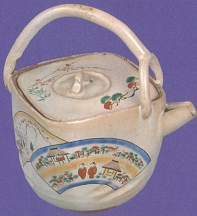
奥田木白「赤膚焼 大和絵酒瓶」江戸時代 公益財団法人 大和文化財保存会蔵