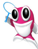
大和郡山市マスコットキャラクター きんとつと