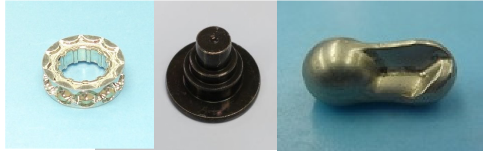
シートベルト部品 エアバック部品 等