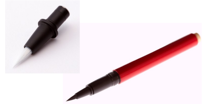
極細アイライナー