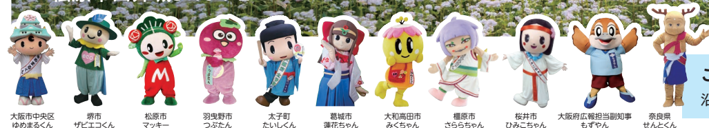
大阪市中央区 ゆめまるくん 堺市 ギャビエッタくん 松原市 マッキー 羽曳野市 つぶたん 太子町 たいしくん 葛城市 蓮花ちゃん 大和高田市 みくちゃん 橿原市 さらちゃん 桜井市 ひみこちゃん 大阪府広務担当副知事 もずやん 奈良県 せんたくん