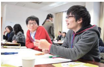
これまでの様子 (第1回2016年1月24日、第2回2016年3月19日開催)