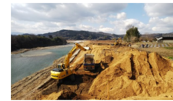
阿田工区(右岸)の進捗状況(五條市)