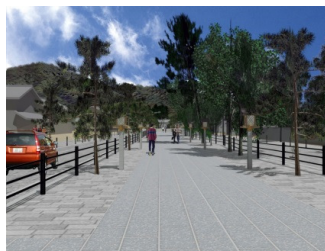
市町村連携によるまちづくり(三輪地区) の完成イメージの一部(桜井市)