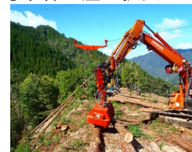
架線集材と高性能林業機械を 組み合わせた木材生産の現場