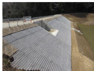
ため池整備 (五條市暮ヶ谷地区)