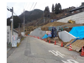
三本松工区の進捗状況(宇陀市)