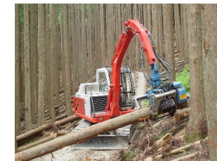
奈良型作業道と高性能林業機械 を組み合わせた木材生産の現場