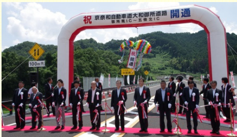
京奈和自動車道大和御所道路 (平成29年8月19日 御所南IC～五條北IC 開通)