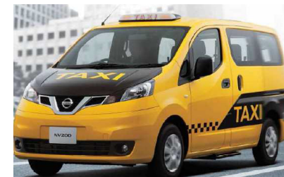
外国人観光客受入環境整備のための ユニバーサルデザインタクシー導入支援