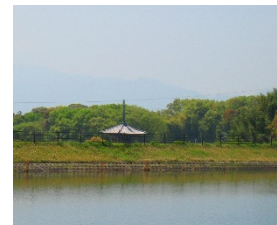
ため池多面的活用 (斑鳩町)