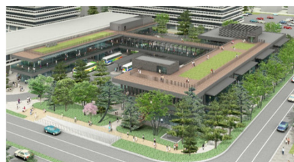
(仮)登大路バスターミナルの完成イメージ