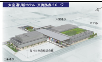
大宮通り新ホテル・交流拠点の完成イメージ