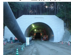
(仮称)清水谷トンネルの進捗状況(高取町)