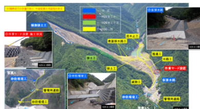
長殿地区の直轄砂防計画(五條市)