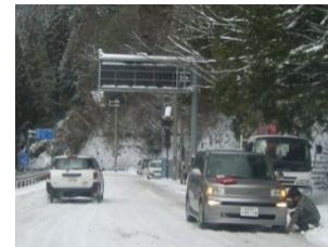
新天辻工区(五條市)