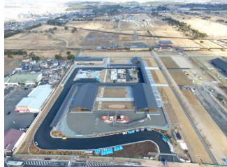
平城宮跡歴史公園 朱雀大路西側の整備状況