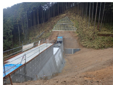
砂防対策工事の推進(山田沢) (天理市)