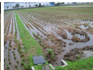
水田貯留 (田原本町阿部田地区)