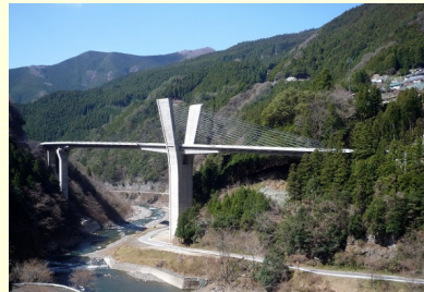
国道168号辻堂バイパス夢翔大橋 (平成30年3月全線開通予定)