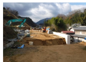
朝町工区の進捗状況(御所市)