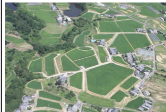
ほ場整備(五條市山陰地区)