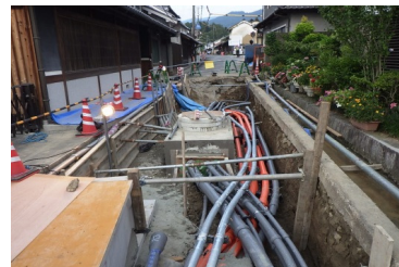
無電柱化の推進(飛鳥区) (明日香村)