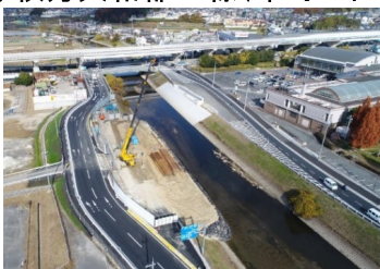
枚方大和郡山線中町工区の整備状況 (奈良市)