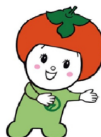
五條市マスコットキャラクター カッキー