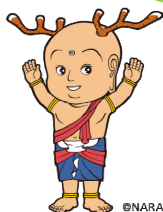
奈良県マスコットキャラクター せんとくん