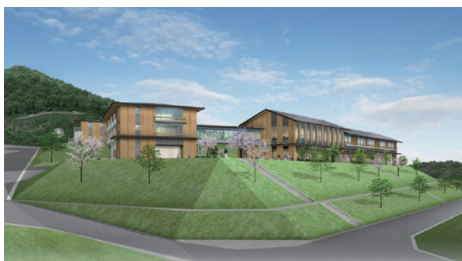
セミナーハウスの整備イメージ