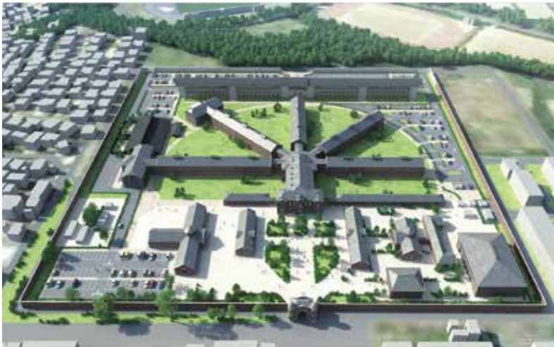
整備後のイメージ