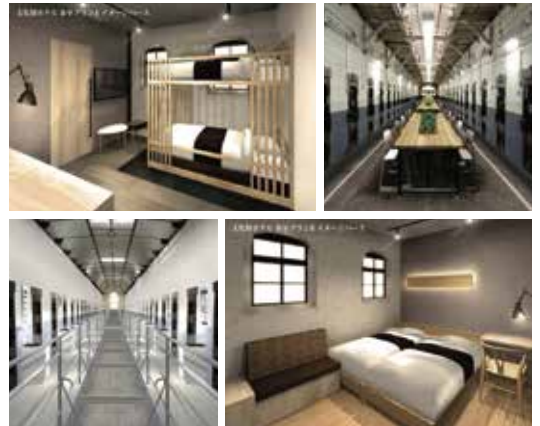
ホテルの内装イメージ