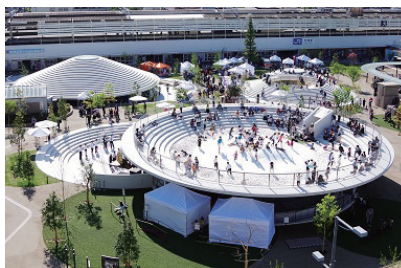
平成29年4月1日にオープンした天理駅前広場コプラン(天理市天理駅前周辺地区)