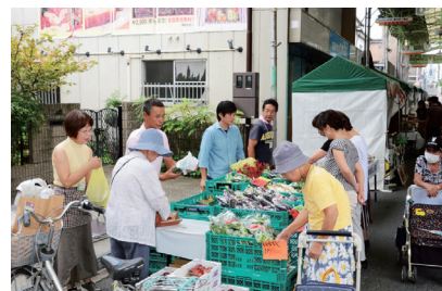
Go-Say(ごせ)ラグビーマルシェ(御所市御所中心市街地地区)