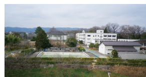
廃止予定の郡山高校城内学舎の活用