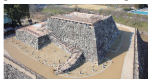
平成28年度に完成した郡山城天守台展望施設