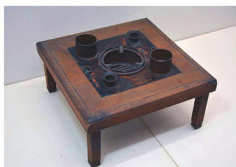
ものづくりの発想「すき焼き台」