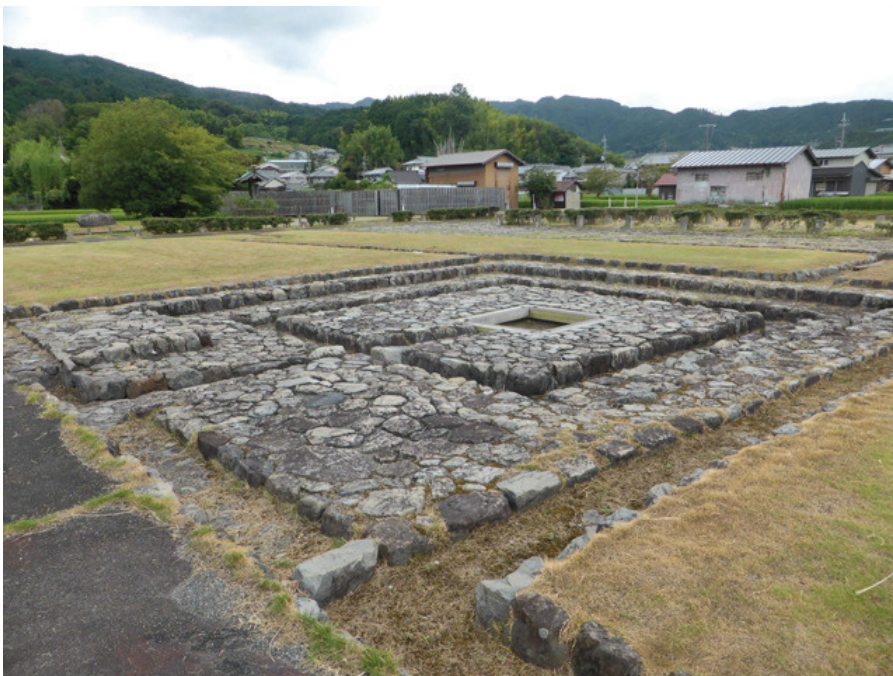
◆復元された大井戸と石敷舗装（内郭北東隅部）