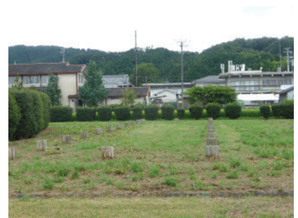
◆計画地内既設遺構表示 （内郭南東隅）