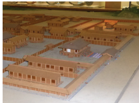
◆飛鳥宮跡復元模型