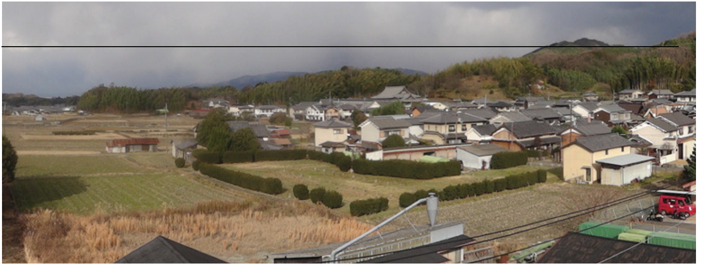
◆明日香村役場屋上から計画対象地の眺め