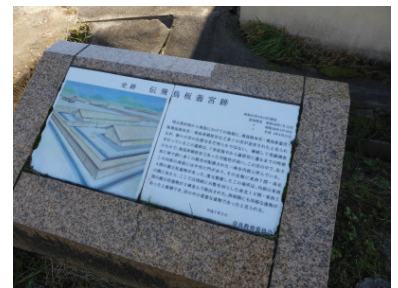
◆計画地内既設解説板②