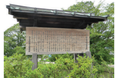
◆計画地内既設解説板①