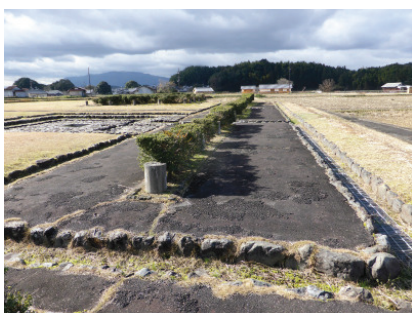
◆計画地内既設遺構表示 （内郭北面掘立柱塀）