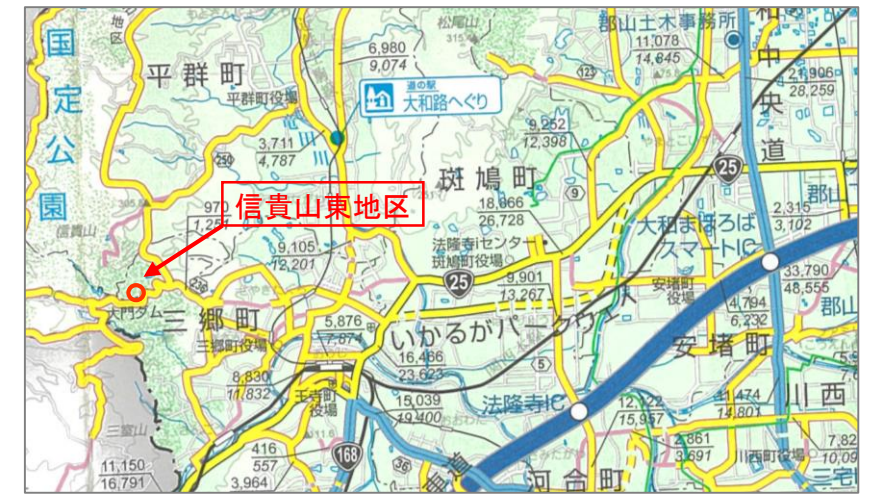
奈良県道路網図(平27情使第780号)を転載