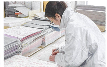
繊維製品製造会社