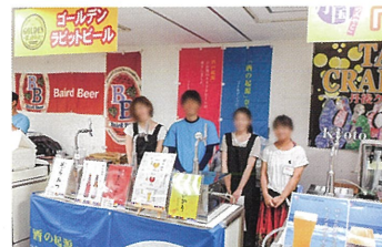
ビール製造販売会社