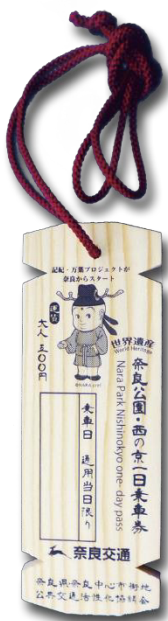
図. 木簡型一日乗車券