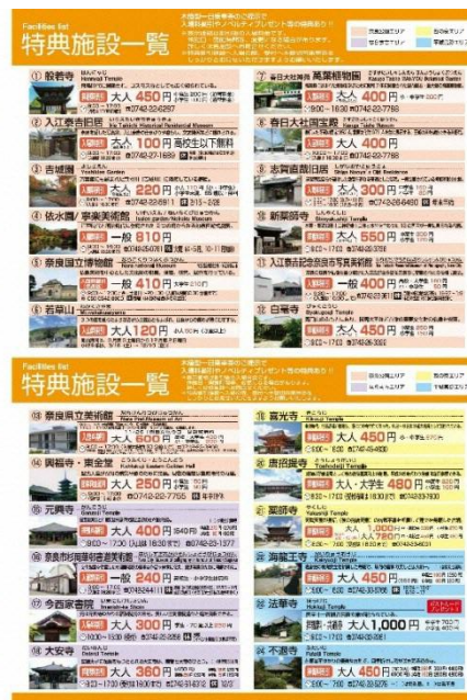
図. 木簡型一日乗車券リーフレット（平成30年度春期）