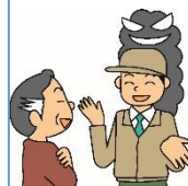
消費者庁「イラスト集」より