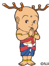
奈良県マスコットキャラクター せんとくん