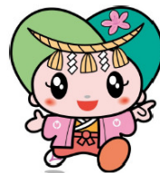
御所市マスコットキャラクター ゴセンちゃん