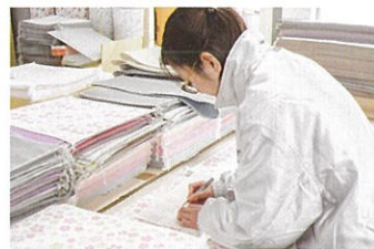
繊維製品製造会社