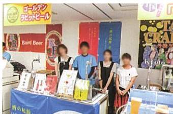
ビール製造販売会社