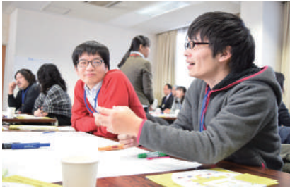
これまでの様子 (第1回 2016年1月24日、第2回 2016年3月19日開催)