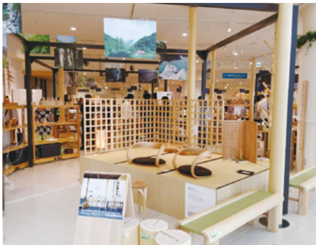
「山と暮らす。奈良奥大和で生まれた生活道具」 ～OKUYAMATO WHOLE LIFE Departmentstore～ (阪神百貨店梅田本店)

平成32(2020)年度までに、南部地域・東部地域の人口の社会増減をプラスにします。