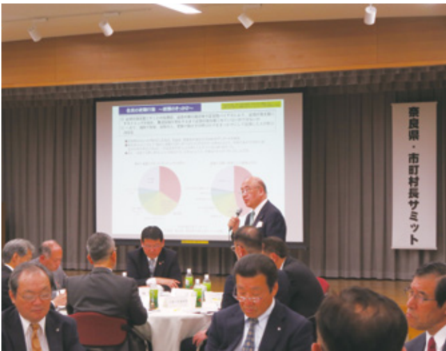
奈良県・市町村長サミット(市町村会館)

平成39(2027)年度までに、県民アンケート調査における地域の活力に対する県民の満足度(自分が住んでいる地域に活気があり、魅力のある地域になっていること)を3.00ポイントに向上させます。