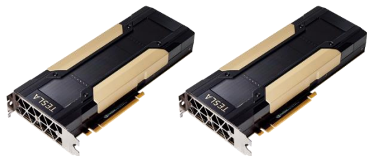
NVIDIA TESLA V100 x 2

47X Higher Throughput than CPU Server on Deep Learning Inference