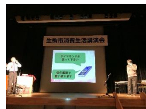
「グループあんあん」 の活動風景