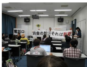
「ざ・ひめみこ」 の活動風景