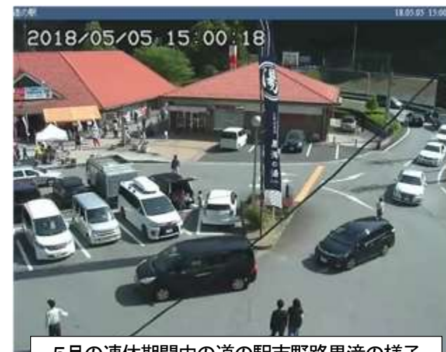
5月の連休期間中の道の駅吉野路黒滝の様子