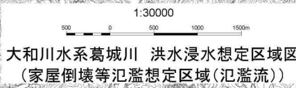
大和川水系葛城川 洪水浸水想定区域図 (家屋倒壊等氾濫想定区域(氾濫流))