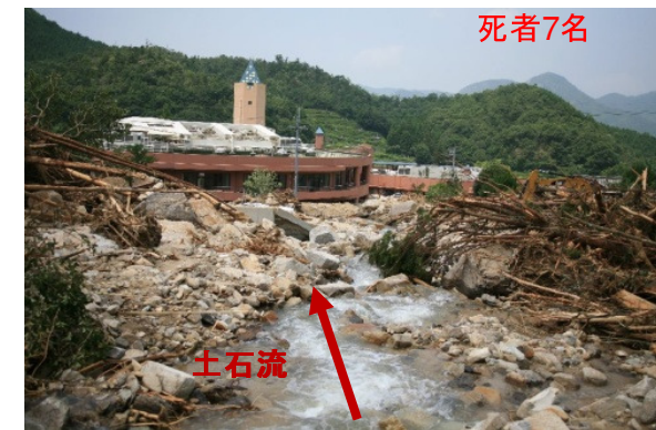
H21.7災害時要援護者施設の被災(山口県)