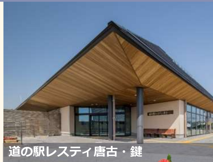
道の駅レスティ唐古・鍵