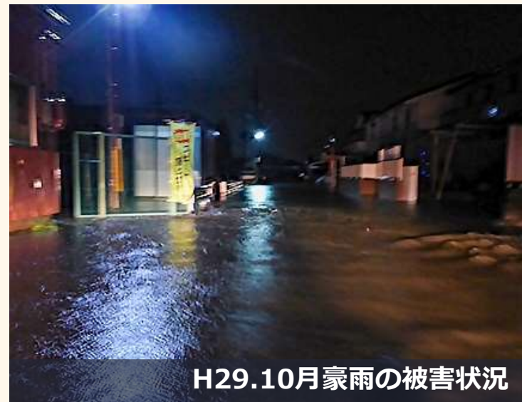
H29.10月豪雨の被害状況