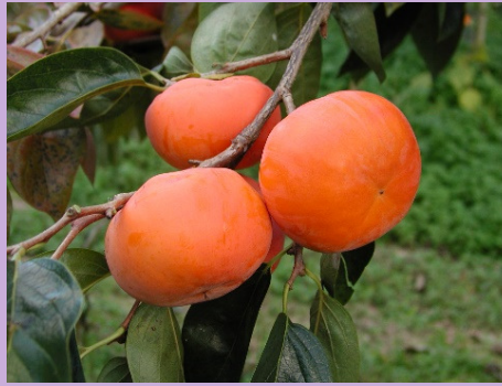
( 〇 有 〇 )