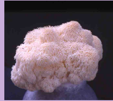
( ヤマ〇〇タケ )