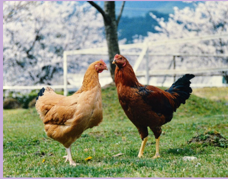
( 大〇〇鶏 )