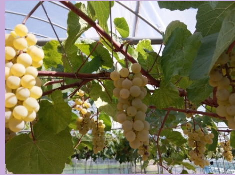
( モン〇〇〇エ )

それぞれの名前を答えられたら、下記いずれかを使ったお菓子をプレゼント 答えがわかった方は受付へ (先着100名様)