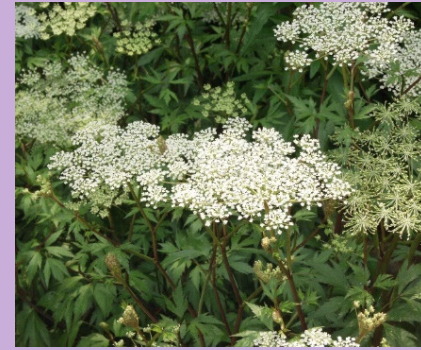
( 大〇〇〇キ )