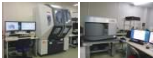
左:多目的X線回析装置 右:顕微レーザーラマン分光測定装置