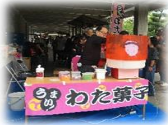
自分で作ろう綿菓子