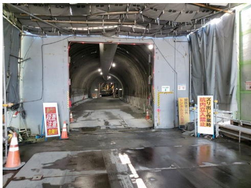
平原五條線(仮称)栄山寺トンネル工事現場