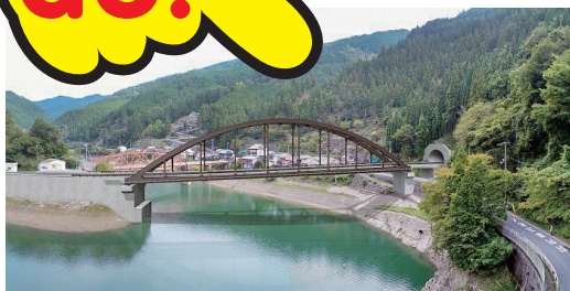
国道168号(仮称)新阪本橋完成イメージ