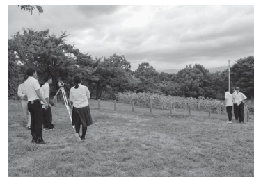
(公社)奈良県測量設計業協会による測量体験