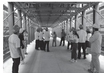
奈良公園バスターミナル現場の視察