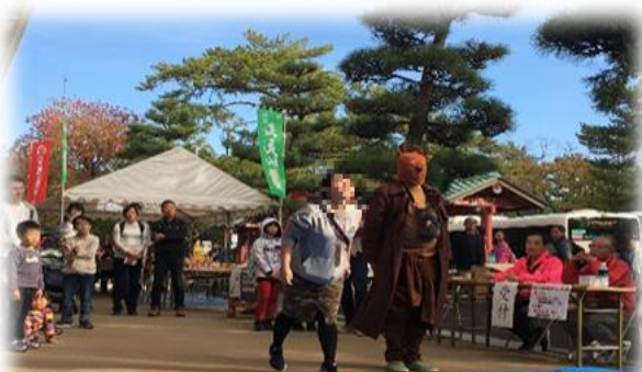
昨年の柿の種飛ばし大会の様子