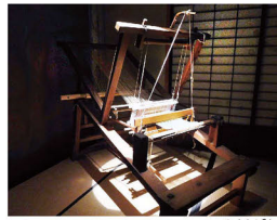
やまとばた 「大和機」