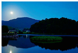
箸墓古墳と三輪山