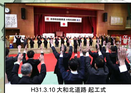
H31.3.10 大和北道路 起工式

京奈和自動車道県内初の開通から10年余 新規企業立地 累計355件 年間20件以上を維持