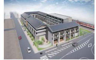
桜井県営住宅(1期)の建替