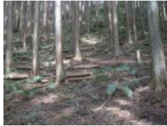
施業放置林の間伐後の状況(明日香村)