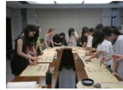
学生交流(中国陝西省)