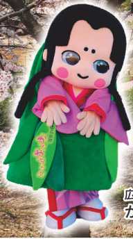
広陵町マスコットキャラクター かぐやちゃん