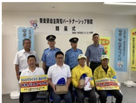
五條警察署長を来賓に招いての贈呈式の様子