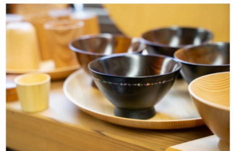
アップルジャックさんの作品一例