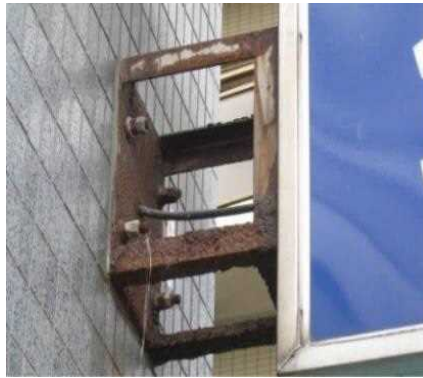
接合部(ブラケットの腐食劣)