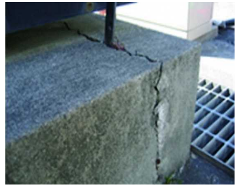
基礎部(基礎のクラック)