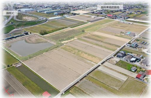
工業ゾーンイメージ