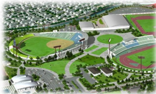
運動公園イメージ