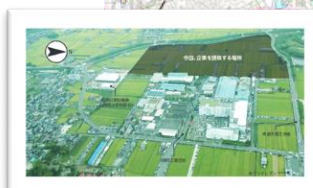
唐院工業団地周辺整備事業 (イメージ)