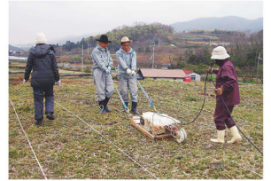
地中レーダー探査の様子 (茅原大墓古墳)

科学的な分析により、詳細な遺跡の姿を明らかにすることができます。今回の特別展では、その分析方法や成果を発掘調査の出土品と共に紹介しています。入館料など、詳しくは下記へ。