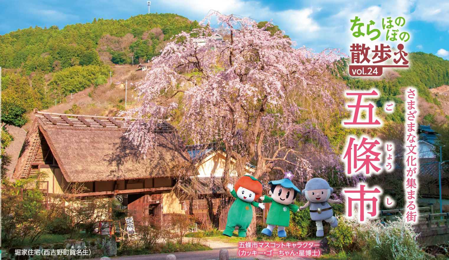
堀家住宅 (西吉野町賀名生)