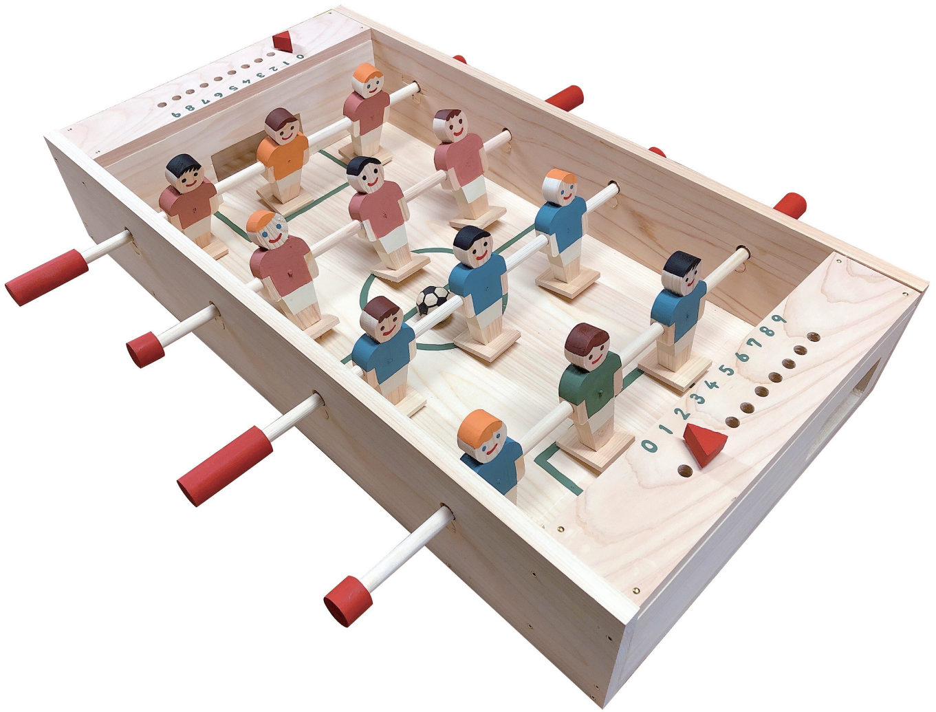
Table football game Табле футбол даме