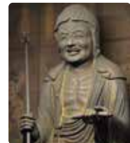
重要文化財 役行者倚像

☒8時半～16時(不定休) ☒500円(小学生以下無料) 特別ご開帳時は800円 ☒吉野郡吉野町吉野山1269 ☎0746-32-5011