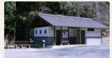
桜井吉野線沿い無料駐車場