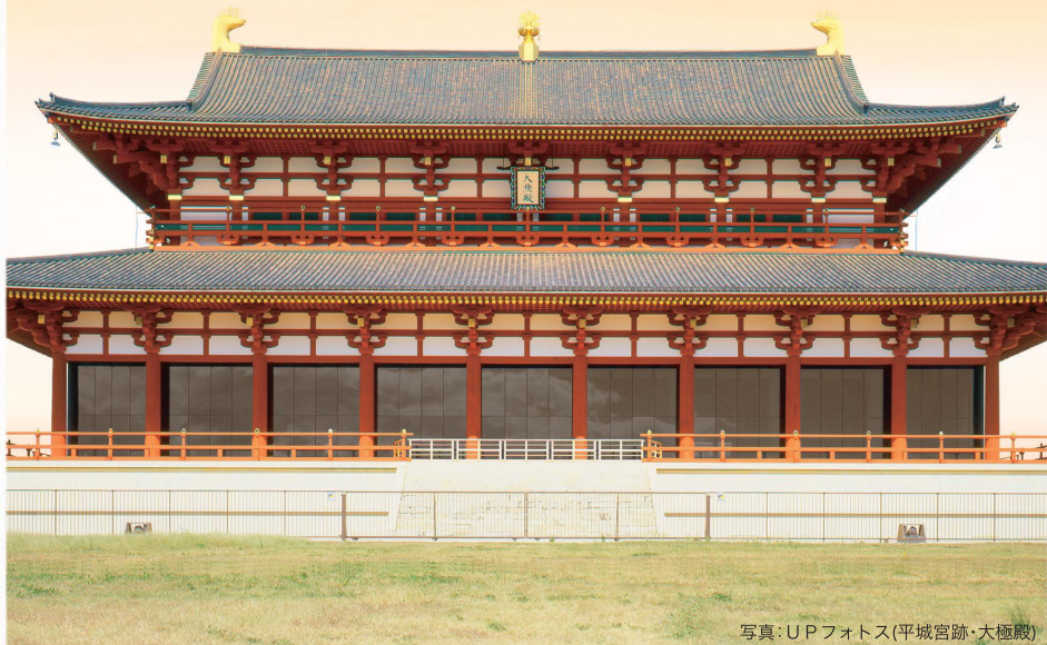
(平城宮跡・大極殿)

奈良県修学旅行ガイドブック〈デジタルブック〉へのアクセス、 観光情報は、「あをによし なら旅ネット」まで。