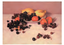
高島野十郎「静物」 昭和22(1947)年 柏市蔵