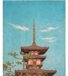
高島野十郎「空の塔 奈良薬師寺」 昭和30(1955)年 個人蔵

一般 1,000円 大・高生 800円 中・小生 600円 没後に光が当てられ、今日では幅広い人気を得ている高島野十郎の、代表作を含む豊富なコレクションを誇る福岡県立美術館の所蔵作品を中心に、初紹介の作品もあわせて展覧します。