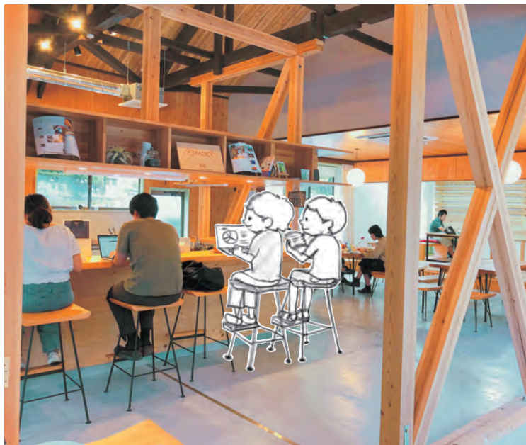
下北山村コワーキングスペースBIYORI