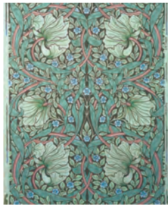
ウィリアム・モリス「ありはこべ」 1876年

ウィリアム・モリスの制作活動は「住まい」「学び」「働いた場所」など、その時々と環境と深いつながりを持っていました。本展ではモリス自身と彼の仲間たちによるデザイン・工芸作品に、写真家 織作峰子さんが撮影したモリスにちなむ風景を組み合わせそのデザインの軌跡をたどります。